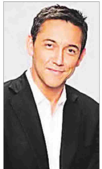
Javier Ruiz Pérez.

Asimismo, fue periodista en Vozpópuli, y estuvo al frente de “La otra red”, en Cuatro, y “Un tiempo nuevo”, en Telecinco. En la actualidad, presenta “Las Mañanas de Cuatro”. Un espacio en el que comenzó como colaborador, y del que se puso al frente tras la marcha de Jesús Cintora.