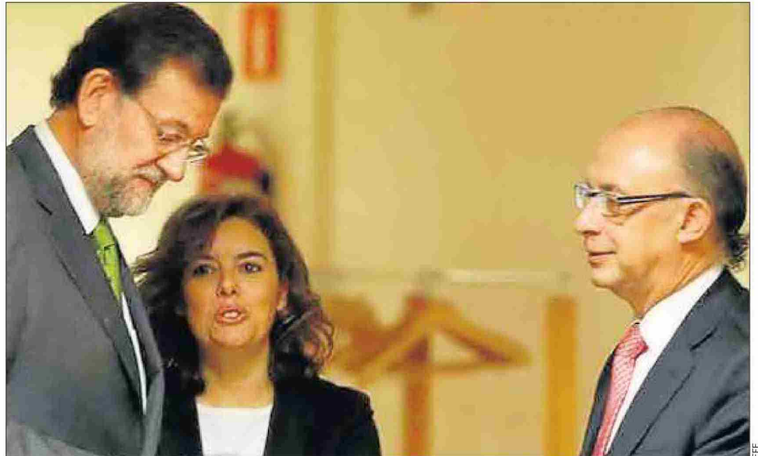
Nombramientos. Mariano Rajoy, Soraya Saénz de Santamaría y Cristóbal Montoro ayer antes del Consejo de Ministros.